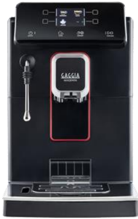
MAGENTA PLUS 5種類 ●