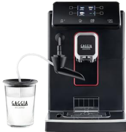
MAGENTA MILK 9種類 ●