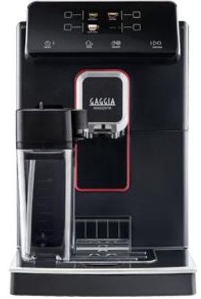
MAGENTA PRESTIGE 12種類