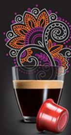
MONORIGINE KAAPI ROYALE